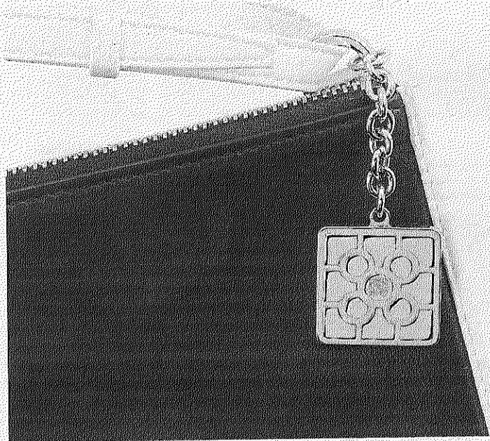
Detalle de la cartera creada por Loewe para la ocasión.