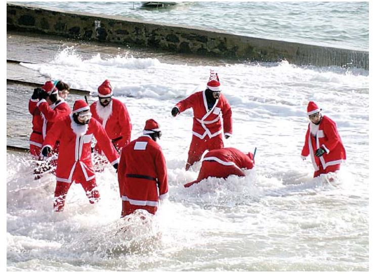
Más de 70 'papa noeles' en el puerto de la ciudad.